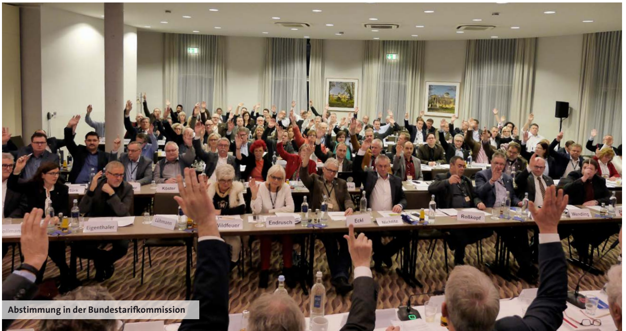
Abstimmung in der Bundestarifkommission

Hier gibt es viel Licht und einen Schatten. Die lineare Erhöhung ist ordentlich. Eingepreist in den Betrag sind 5 Euro Lernmittelzuschuss. Außerdem wird es zukünftig einen Urlaubstag mehr (29 Tage) für Azubis geben. Dass jedoch die Länder sich weiterhin weigern, ihren Azubis eine unbefristete Übernahmegarantie zu geben, ist ärgerlich und unverständlich. Im Wettbewerb um qualifizierten Nachwuchs haben sich die Länder mit dieser Verweigerungshaltung keinen Gefallen getan.