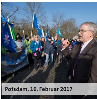
Potsdam, 16. Februar 2017